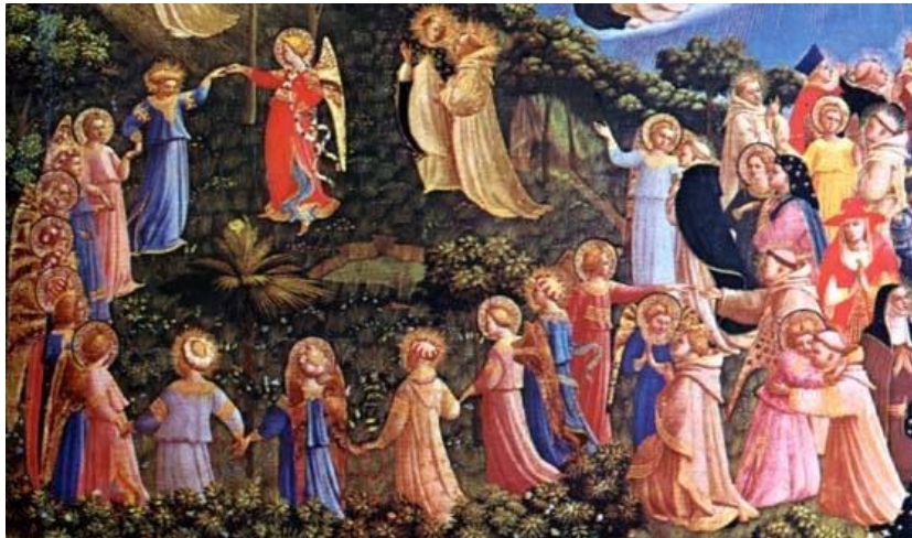
« La ronde des saints » de Fra Angelico

Les premières feuilles mortes sont là, les jours raccourcissent, la pluie revient après cette belle pause estivale,... Avec l'arrivée de l'automne, se profile aussi la fête de la Toussaint !