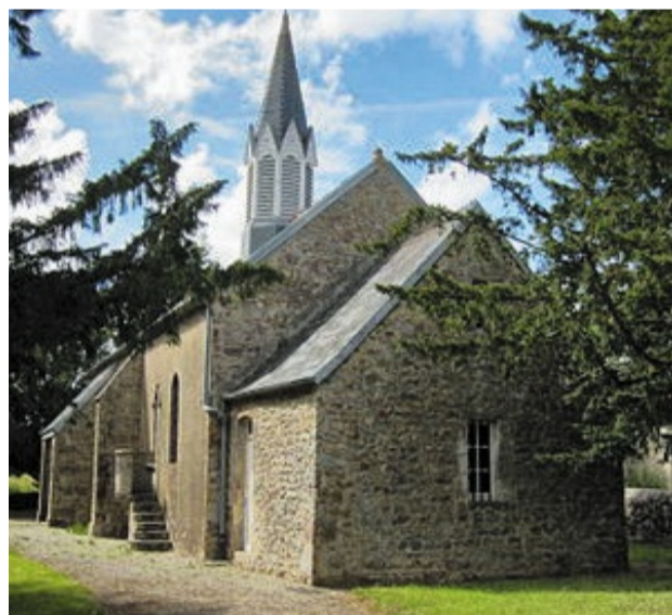
→ Chapelle Notre-Dame de la Délivrande, avec une chaire extérieure. Le Mont, Rauville-la-Place.