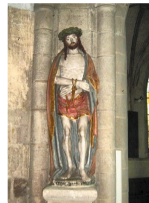
→ Le Christ aux liens. Statue en pierre polychrome du XVI e . Église Saint-Jean-Baptiste, Saint-Sauveur-le-Vicomte

G. Manuelle Dhucq, L. Thual-Tarin en collaboration avec Claire Yvon, Pays d'art et d'histoire du Clos du Cotentin