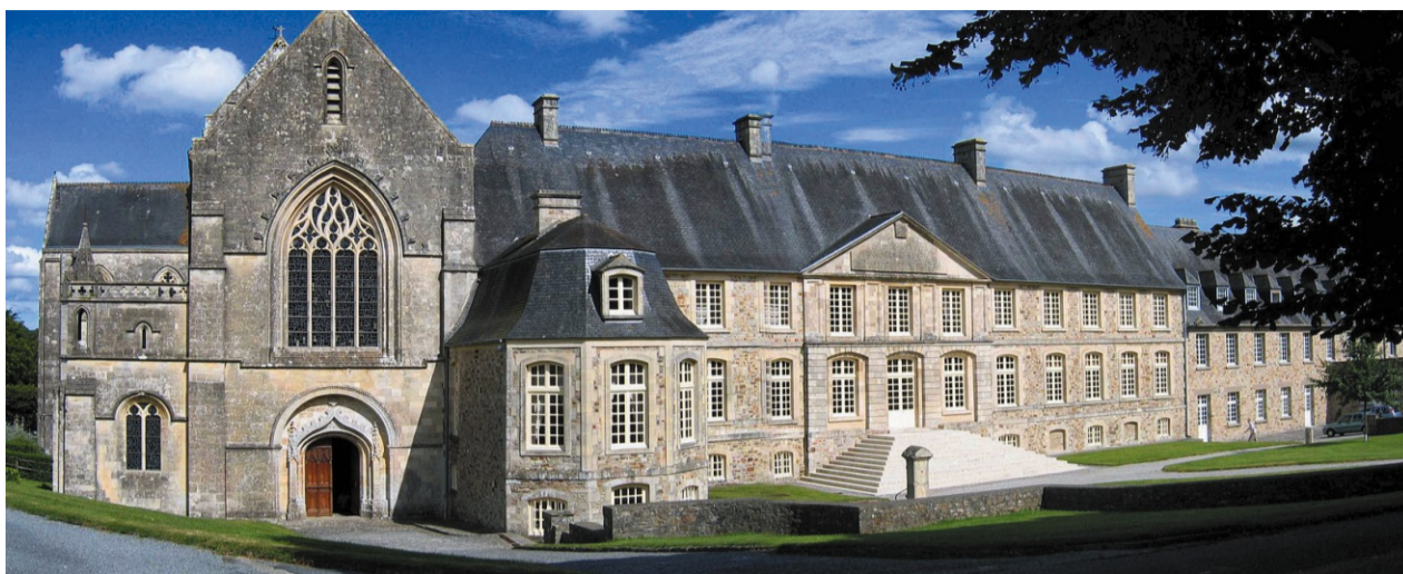
→ L'abbaye de Saint-Sauveur-le-Vicomte.

Redescendre vers Saint-Sauveur-le-Vicomte et prendre le chemin du camping municipal, au pied du château. Dans le petit cimetière, tombeau de Jules Barbey-d'Aureville et de son frère Léon. Prendre le chemin le long du bowling et remonter vers la mairie. Traverser la place et prendre la rue des Lices (direction maison de retraite). Après la maison de retraite, prendre la première rue à gauche, la rue Flandres-Dunkerque 1940 puis, presque en face, la rue Catherine-De Longpré (plaque). Vous arrivez rue Bottin-Desyilles. À droite se trouve le musée Barbey d'Aureville installé dans la maison natale de l'écrivain. Traverser la rue et prenez à gauche pour découvrir l'église Saint-