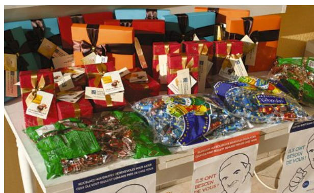
Des belles actions.